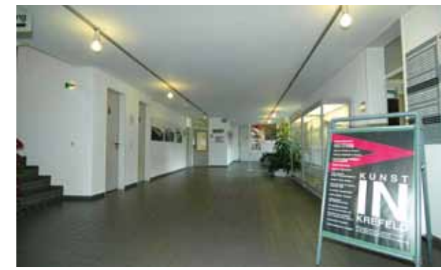
Foyer, Stadtarchiv Krefeld

Neben regelmäßigen Ausstellungen zur Stadtgeschichte finden im Foyer des Hauses Kunstaussstellungen statt. Termine auf Anfrage.