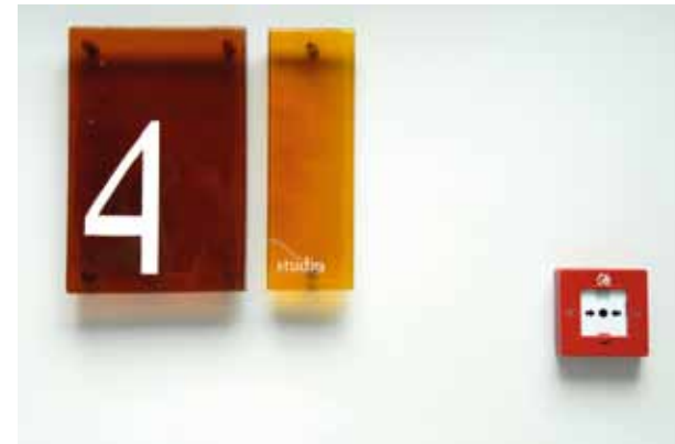
twist-impersions, Architektur und Stimmungen außerhalb der Performance Fotografie