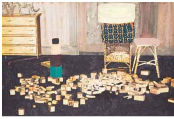
RUIN, 2010, Acryl und Öl auf Tafel, 81 x 122 cm