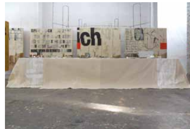
Dreizehn Quadrate für ein Abendmahl