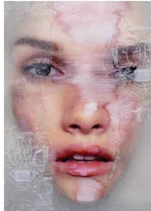
Under the surface, 2010, Mischtechnik mit Kunstharz, 100 x 80 x 15 cm