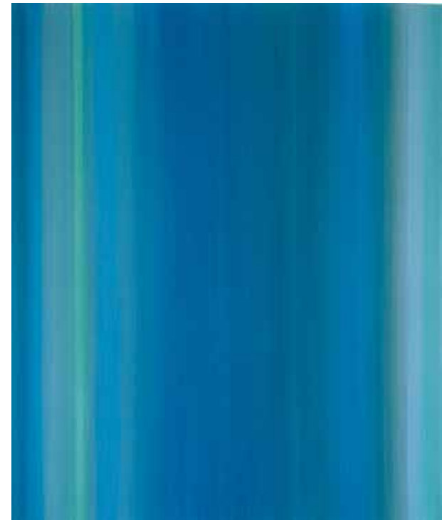
ohne Titel, 2011, Acryl auf Leinwand, 120 x 100 cm