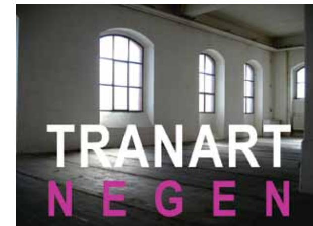
TRANART NEGEN - paperworkout installation-zeichnung-objekt