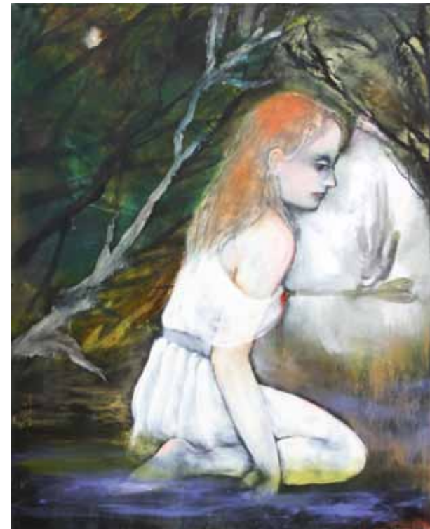
the arrow, 2010, Öl / Leinwand, 100 x 80 cm