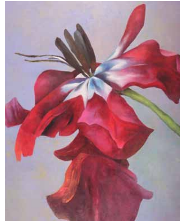
Tulpe, tanzend, 2008, Öl / Nessel, 200 x 160 cm