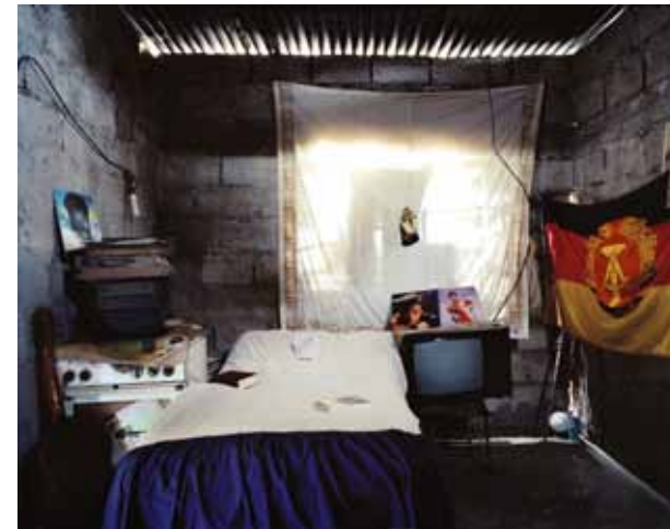
Einheit, Arbeit, Wachsamkeit; Die DDR in Mosambik Fotografie