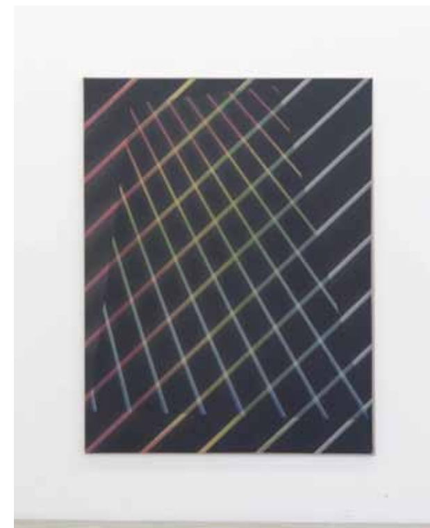
Christian Freudenberger - AL.O. # 1002, Lissy Lissy, 2011 Pigmentdruck auf Leinwand, 195 x 150 cm, Unikat, Courtesy: DREI, Köln Foto: Baegle/ Krypczyk