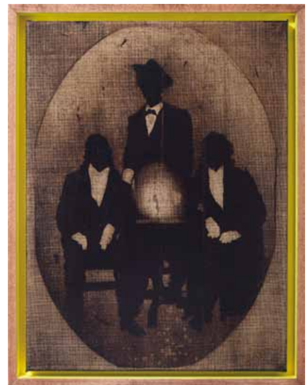
Henning Kles - B.H.H.#2, 40x30cm, Bitumenemulsion auf Leinwand, 2011