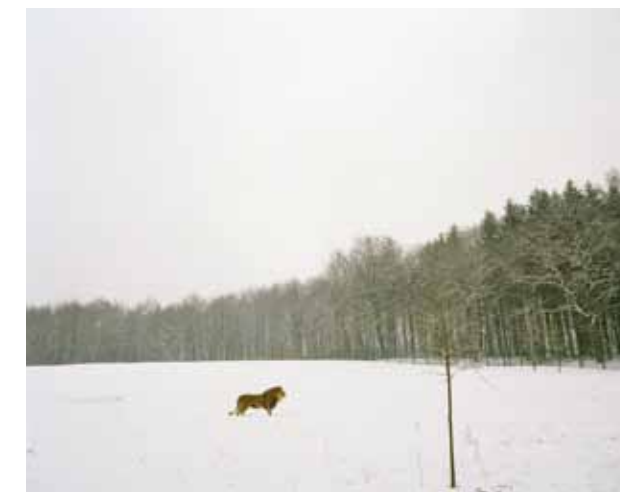
82 x 103 cm, Inkjet-Druck, UltraChrome HDR-Tinte