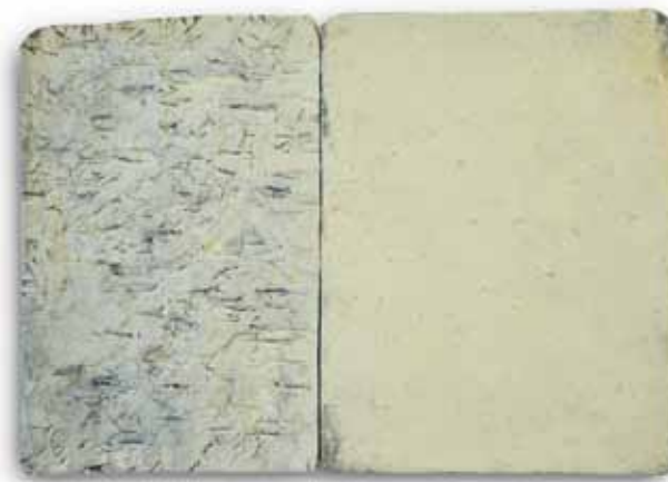
Dan Hepperle - ohne Titel, 2011, Öl/ Paraffin auf Holz und Leinwand, 38 x 54 cm