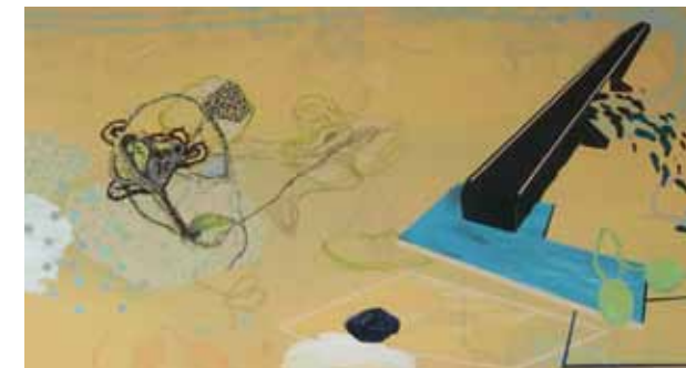
Bild 1 - Erinnerung an Meer, 2011