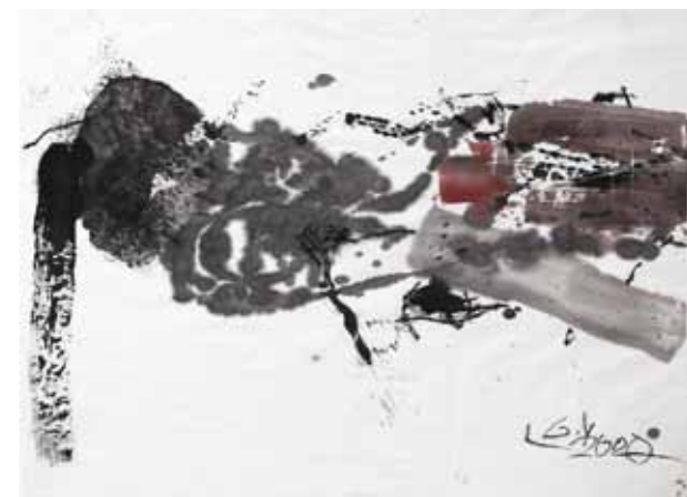
Liu Guangyun - ohne Titel, 90 x 100 cm, Tusche auf Papier