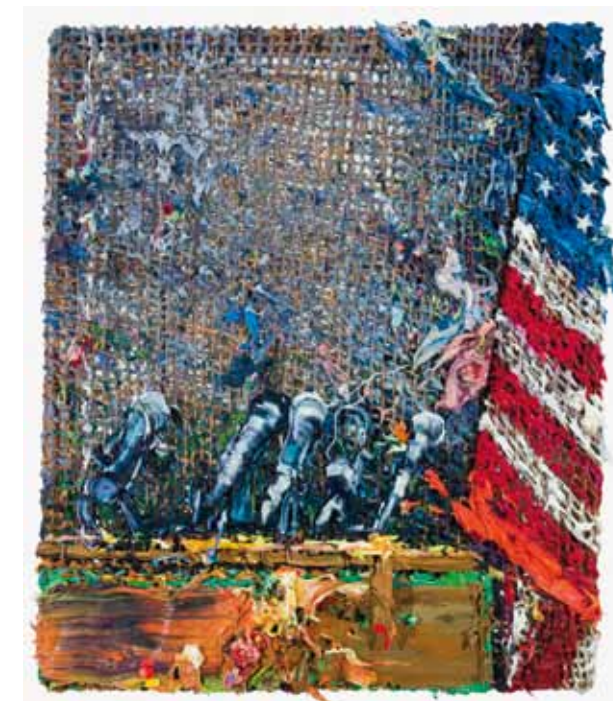
Fabian Marcaccio, Podium, 2011 · Holz, Seil, Alkydfarbe und Silikon, 244 x 208 x 15 cm Martin Nielsen Collection, Dänemark