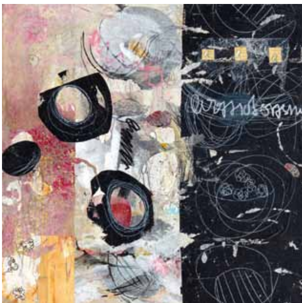
Ulrike Stausberg, 80 x 80 cm, Mischtechnik/Collage auf Leinwand, 2014