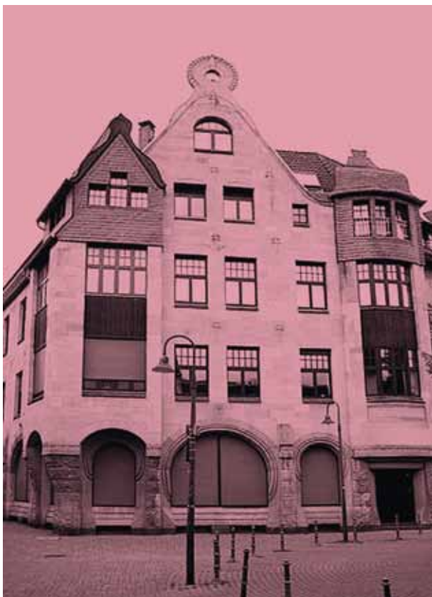
Alte Post, Steinstraße

Regelmäßige Ausstellungen in unserer Galerie. Termine auf Anfrage.