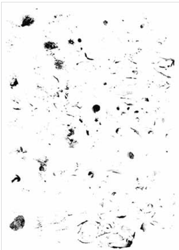
The Economist (Detail), 2014