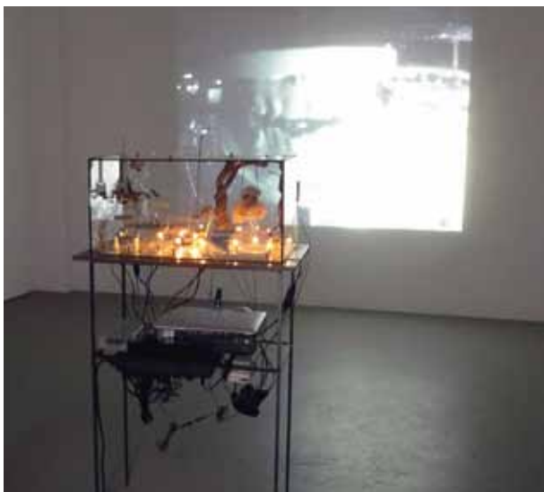
Oskar Klinkhammer, Das Karussell, Vido und Mixed-Media, 120 x 80 x 40 cm, 2011

Ralf Berger Stefan Hoderlein Oskar Klinkhammer