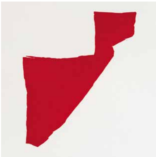
Willy Heyer, o. T., Linoldruck, 30 x 40 cm, 2012